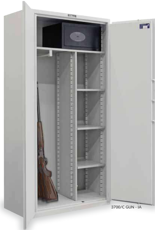
3700/C GUN - IA