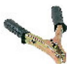
COLORADO 150B PINZA DI MASSA 150A 712001