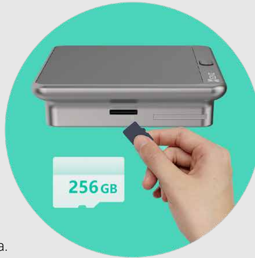
Supporta schede micro SD 3

Potrai salvare i video localmente su una scheda di memoria da 256 GB, che può essere inserita nel monitor interno. Ciò garantisce la sicurezza dei dati in caso di danneggiamento della telecamera esterna. Oppure, se preferisci, puoi abbonarti a EZVIZ CloudPlay per usufruire di un servizio di archiviazione su Cloud completamente crittografata.