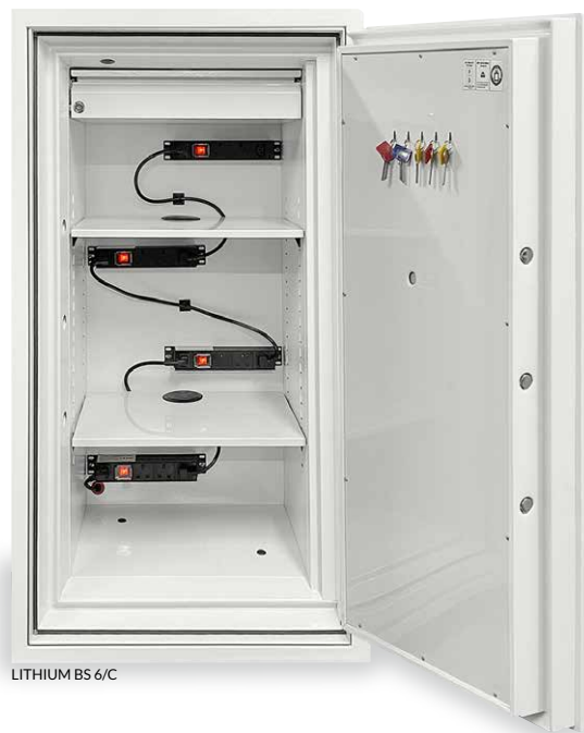
LITHIUM BS 6/C