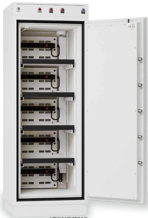
LITHIUM BS PRO 8/C