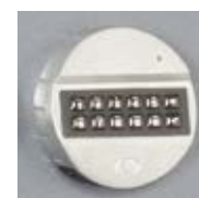
Mod. E e Mod. KE