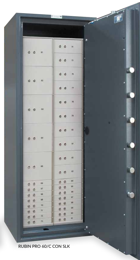
RUBIN PRO 60/C CON SLK