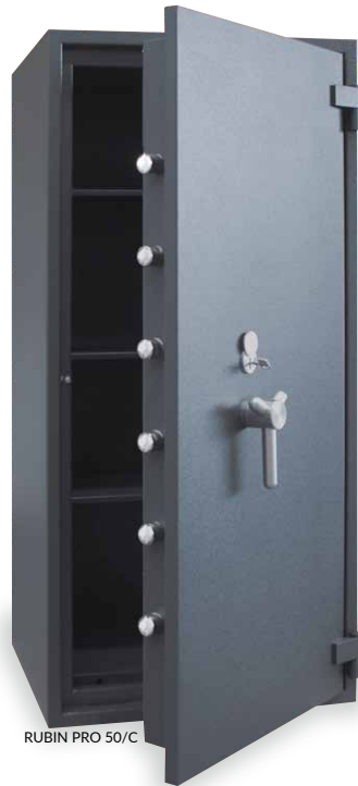
RUBIN PRO 50/C