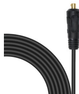
CAVO TW05V-A 1X025 L=1.80M SPINA 124589