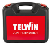
VALIGETTA IN PLASTICA 322800