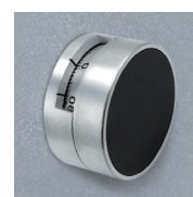
Mod. KC: LG3390+LG1730