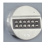
Mod. KE : EM2020+T6530